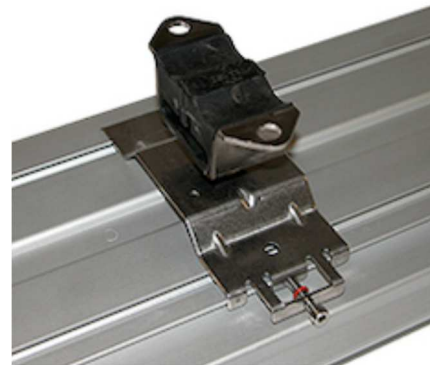
9840281400 (fixation triangle)