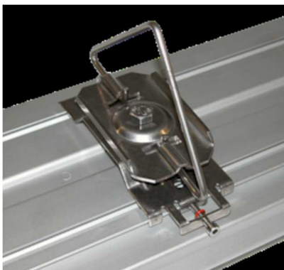
9840265100 (Cillet de fixation)