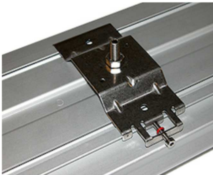
8175114500 (fixation anti vibration)